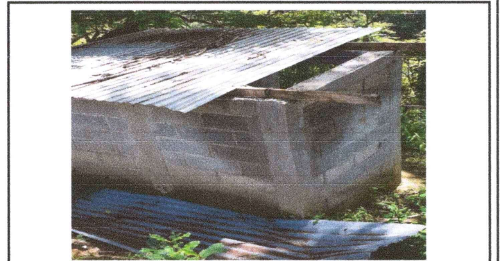
FOTO 2. Cambio de techo de baño